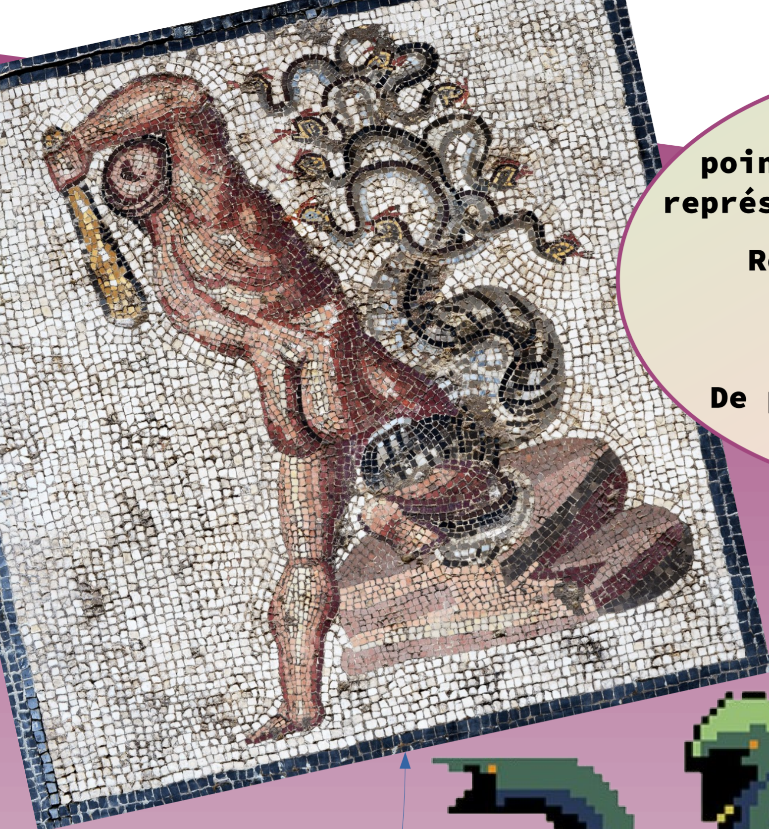
Image faite en mosaïque, assemblage de morceaux de pierres colorées, d'émail, de verre ou de céramique appelés « tesselles »

Plus d'informations : RDV au CDI ou salle 110, auprès de Mme Thielleux